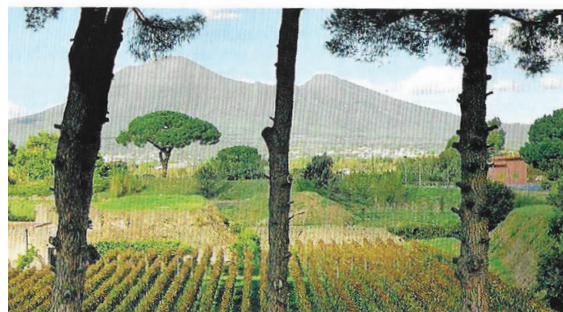
1 | Il vigneto gestito dall'azienda Mastroberardino nel cuore di Pompei. 2 | Il golfo di Napoli dalle pendici del Vesuvio. 3 | Il cortile della Palestra grande, sempre a Pompei. Il sito ha riaperto in estate dopo la chiusura forzata.

Dopo gli interventi di manutenzione sono state riaperte anche le Terme suburbane. Nella Casa del Menandro è esposto il Cisium , il tipico carro utilizzato per il trasporto delle merci, che conserva ancora parti originali. E nella zona