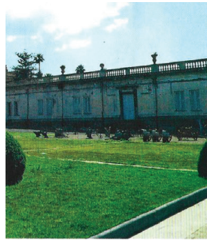
4 | Il Museo nazionale ferroviario di Pietrarsa (Na). 5 | La suite Durante di Villa Durante, residenza di appartamenti a Ercolano (Na).

DOVE Mensile RCS Mediagroup Tiratura: 80.000 copie