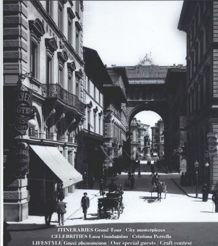
ITINERARIES Grand Tour - City masterpieces CELEBRITIES Luca Guadagnino - Cristiana Perrella LIFESTYLE Guesi phenomenon - Our special guests - Craft contest